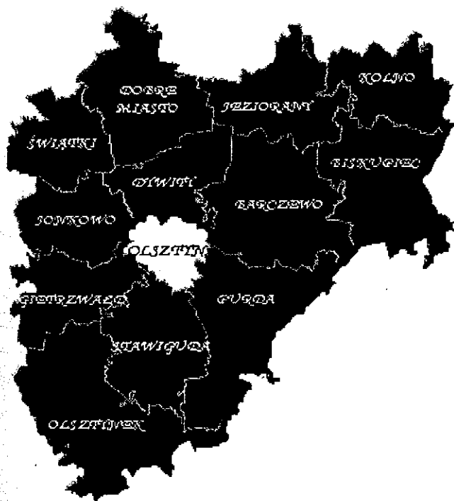
RYSUNEK NR 1. Położenie Gminy Jonkowo na tle Powiatu Olsztyńskiego

Gmina Jonkowo położona jest w zachodniej części województwa warmińsko-mazurskiego, w powiecie olsztyńskim, około 15 km w kierunku północno-zachodnim od miasta Olsztyn – stolicy województwa. Gmina leży na uboczu od ważniejszych szlaków komunikacyjnych. Powiązana jest z sąsiednimi gminami i miastem Olsztyn drogami wojewódzkimi oraz linią kolejową relacji Olsztyn – Morąg. Gmina zalicza się do mniejszych w województwie i charakteryzuje się zwartym obszarem o kształcie zbliżonym do koła. Centrum administracyjno-usługowym jest wieś Jonkowo, siedziba władz gminnych.