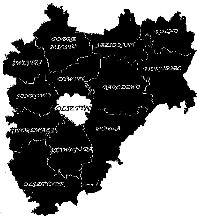
RYSunEK NR 1. Położenie Gminy Jonkowo na tle Powiatu Olsztyńskiego

Gmina Jonkowo położona jest w zachodniej części województwa warmińsko-mazurskiego, w powiecie olsztyńskim, około 15 km w kierunku północno-zachodnim od miasta Olsztyn – stolicy województwa. Gmina leży na uboczu od ważniejszych szlaków komunikacyjnych. Powiązana jest z sąsiednimi gminami i miastem Olsztyn drogami wojewódzkimi oraz linią kolejową relacji Olsztyn – Morąg. Gmina zalicza się do mniejszych w województwie i charakteryzuje się zwartym obszarem o kształcie zbliżonym do koła. Centrum administracyjno-usługowym jest wieś Jonkowo, siedziba władz gminnych.