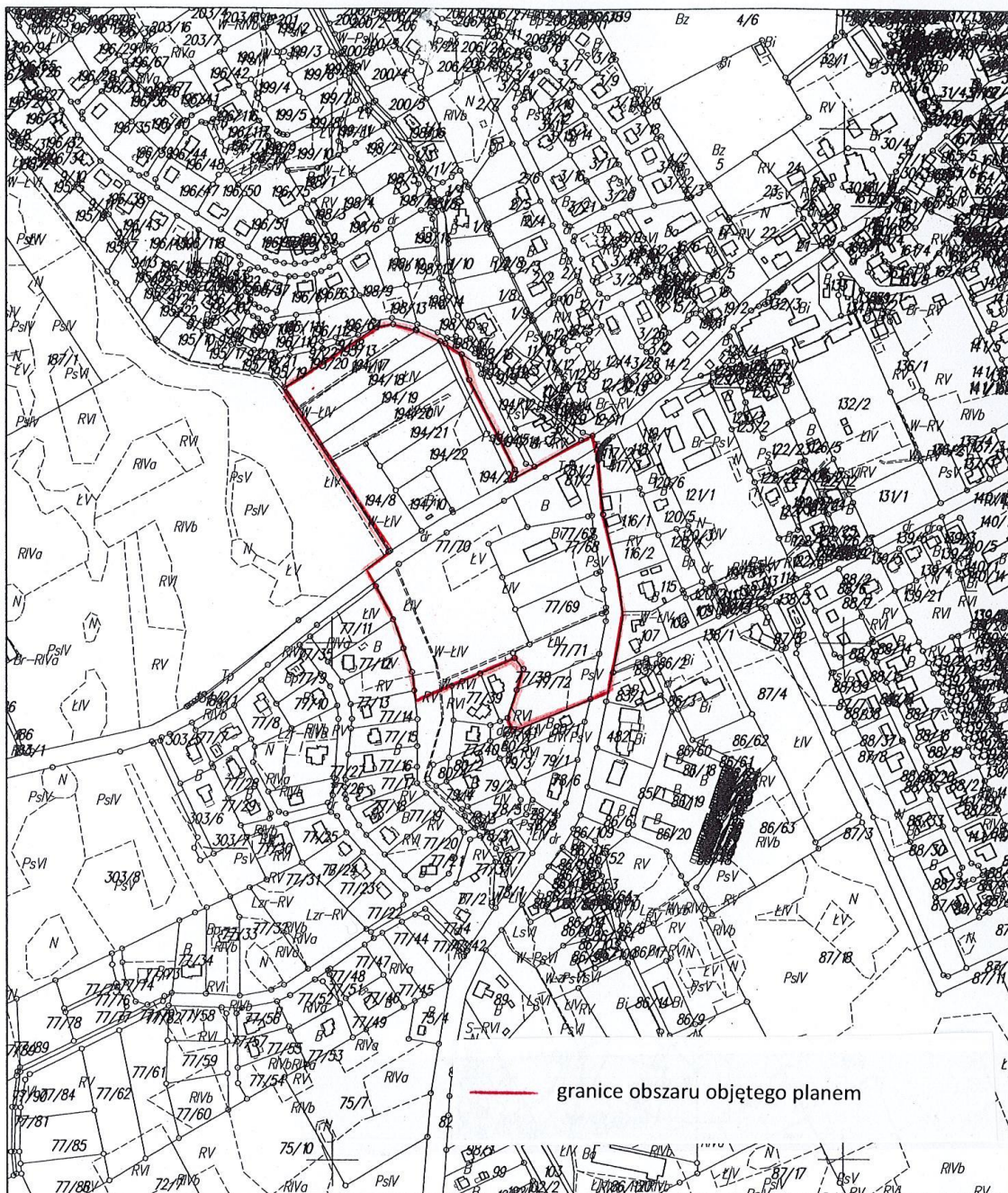
— granice obszaru objętego planem