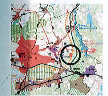
WYRYS ZE STUDIUM GMINY JONKOWO